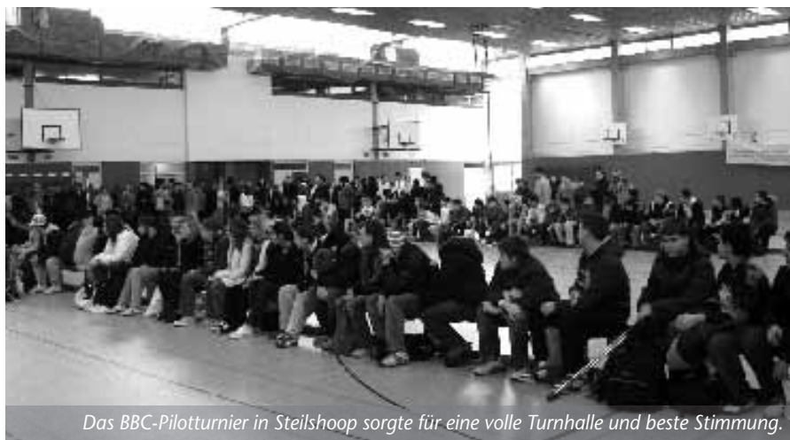
Das BBC-Pilotturnier in Steilshoop sorgte für eine volle Turnhalle und beste Stimmung.