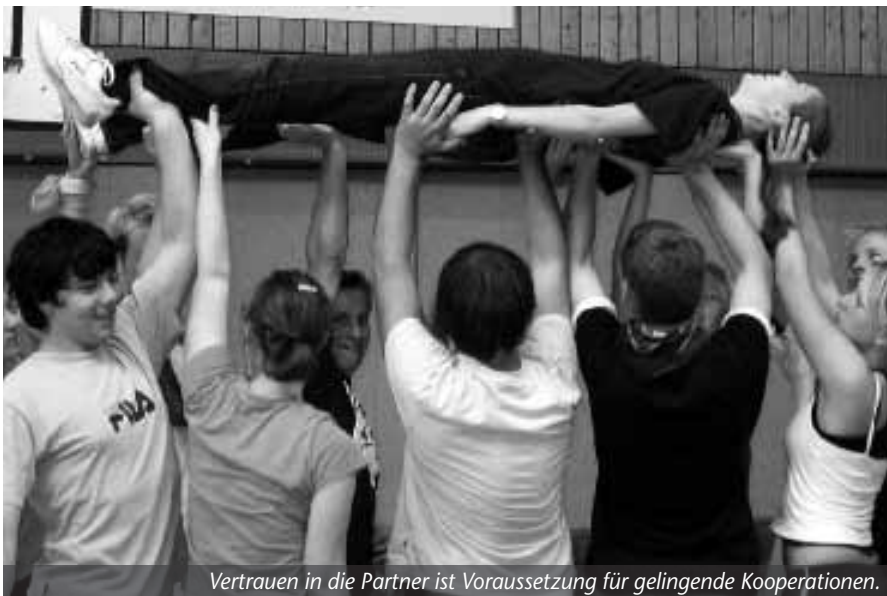
Vertrauen in die Partner ist Voraussetzung für gelingende Kooperationen.

IN DIESER AUSGABE: Lehrgangsprogramm 2008 ZUM HERAUSNEHMEN UND AUFBEWAHREN SEITE 7 BIS 18