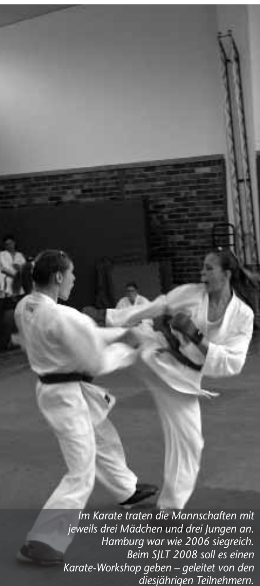
Im Karate traten die Mannschaften mit jeweils drei Mädchen und drei Jungen an. Hamburg war wie 2006 siegreich. Beim SJLT 2008 soll es einen Karate-Workshop geben – geleitet von den diesjährigen Teilnehmern.

Der Höhepunkt ist die Abschlussparty am Ende jedes Treffens, der gemeinsam gestaltet wird und bei dem die sportlichen Sieger gekürt werden. Vom 2.-6. Oktober 2008 wird Hamburg erstmals Gastgeber für das Sportjugendländertreffen sein. Wir freuen uns auf die 250 Gäste und werden ein attraktives Programm auf die Beine stellen.