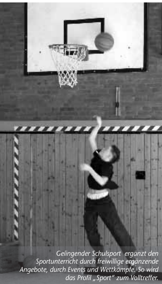
Gelingender Schulsport ergänzt den Sportunterricht durch freiwillige ergänzende Angebote, durch Events und Wettkämpfe. So wird das Profil „Sport“ zum Volltreffer.