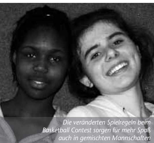
Die veränderten Spielregeln beim Basketball Contest sorgen für mehr Spaß auch in gemischten Mannschaften