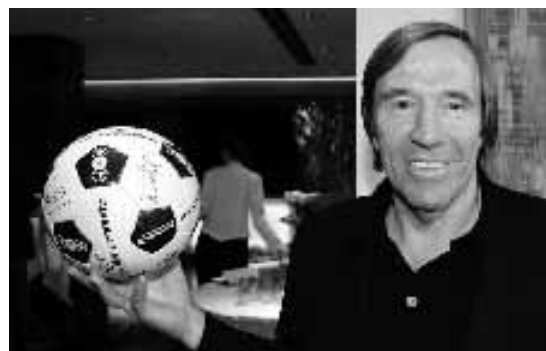
Eine Fußball-Legende: Günther Netzer