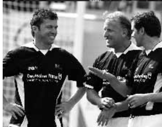
Weltmeister unter sich: Lothar Matthäus, Andreas Brehme und Andreas Möller