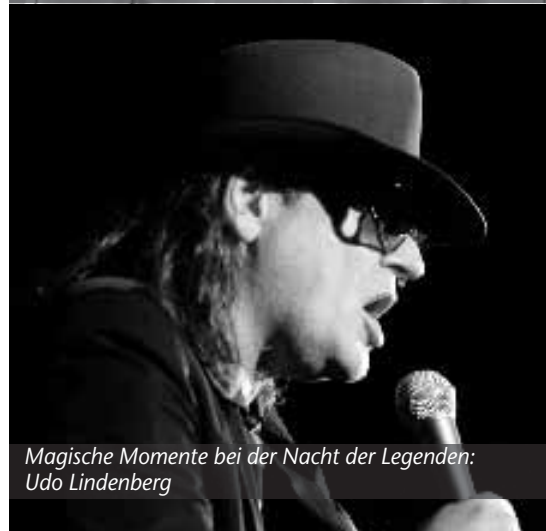
Magische Momente bei der Nacht der Legenden: Udo Lindenberg