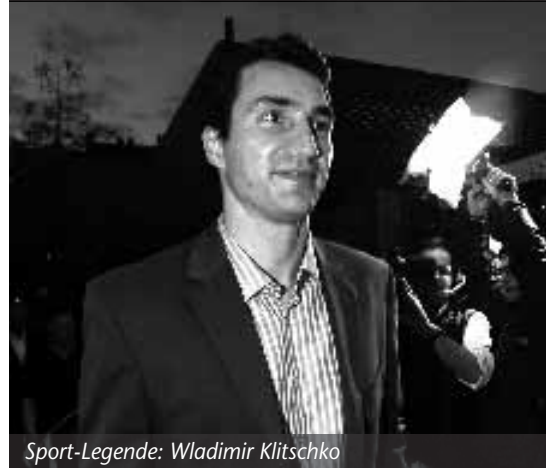
Sport-Legende: Wladimir Klitschko